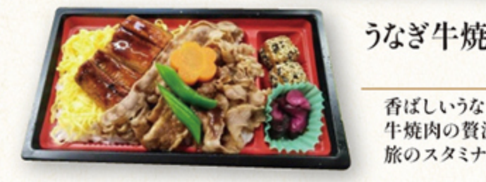
うなぎ牛焼肉弁当 1,380円

福岡・糸島豚を香ばしく焼き上げた贅沢なお弁当。ジャボネソースをかけてお召上がりください。