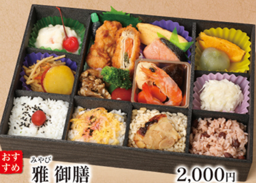
おすすめ みやび 雅御膳 2,000円

彩豊かな料理を少しずつ詰め合わせた贅沢な一箱です。冠婚葬祭などの大切な日やおもてなしの席におすすめです。