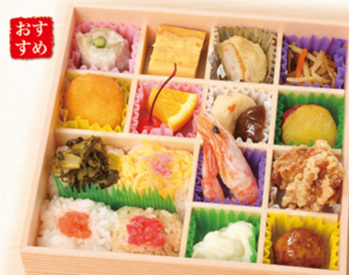
おすすめ 十六彩弁当 1,200円

十六種類のお弁当を彩りよく詰め合わせた、最後の一口まで楽しめるお弁当。女性人気が高いです。