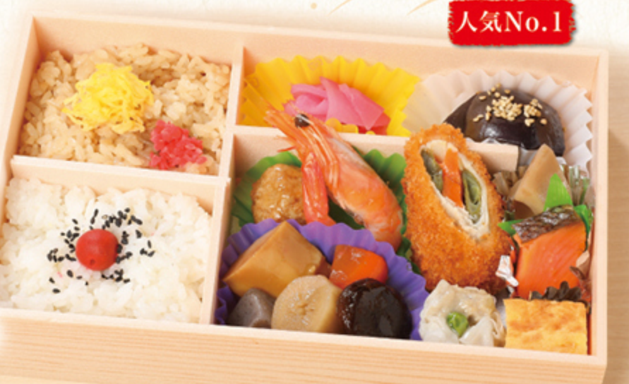
人気No.1 味自慢 1,280円

旅のお共にぴったりの味自慢弁当。老若男女問わず楽しめる当店駅弁人気No.1です。