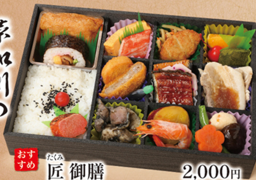
おすすめ たくみ 匠御膳 2,000円

見た目にも華やかな料理を少しずつ楽しめる御膳。冠婚葬祭などのお祝いの席や大切なひと時にぴったりのお弁当です。